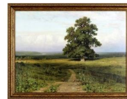
Шишкин «Среди долины ровныя»