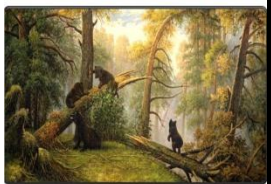
Шишкин «Утро в сосновом бору»