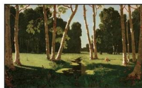
Куинджи «Березовая роща»